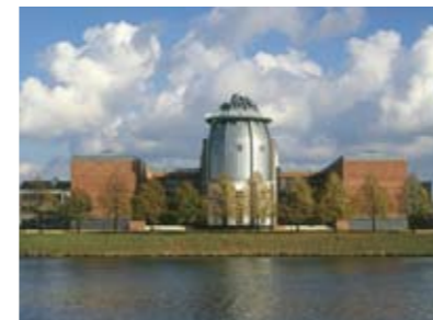
^ Bonnefantenmuseum Maastricht

Maastricht is practically synonymous with art, and not only because of the prestigious annual international art and antique fair, TEFAF. At the Bonnefantenmuseum you can marvel at 16th-century Flemish paintings, early Italian art, Minimal art and Arte Povera. The centre for contemporary culture, Marres, presents unique exhibitions, video screenings, lectures, performances and debates. NAIM/Bureau Europa keeps a close eye on developments in contemporary architecture in Maastricht and the Euregio. Both the contemporary exhibitions at Centre Céramique and the 18th-century collections at the Museum aan het Vrijthof (closed in 2011 for renovations) present a wonderful portrait of the respective eras in Maastricht. See reverse side for the locations of the star attractions.