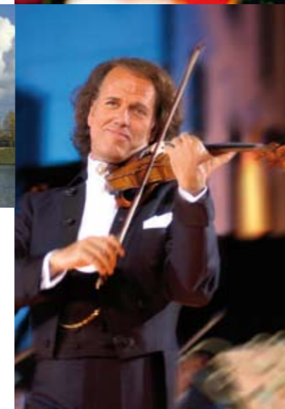
^ André Rieu